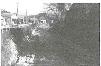
血流川 稲荷橋下流

入札を早い時期の3月提案・実施することになりました。中沢区、台風災害による土手の改修は6月を目途に改修完了の予定です。